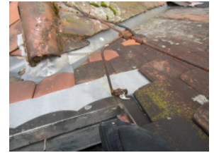
Korrosion an Fangeinrichtung

Ihr Gebäude verfügt über eine – vielleicht schon etwas ältere - Blitzschutzanlage. Sicher wurde bei der Planung, Auswahl der Materialien und Ausführung auf Qualität geachtet, um Ihr Gebäude dauerhaft vor den Einwirkungen von direkten Blitzeinschlägen zu schützen. Was sollten Sie dennoch beachten?